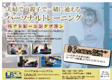
【チラシイメージ表】